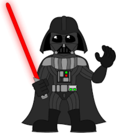
SCI FI FANS