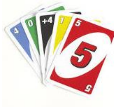
CARD GAME FANS