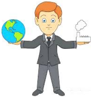
ENVIRONMENT ENGAGED PEOPLE